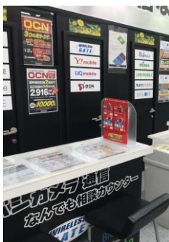
スタッフの説明・安心貸出