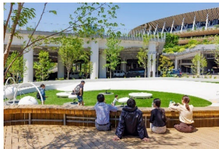
インクルーシブ広場