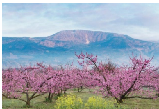
福島県伊達郡桑折町