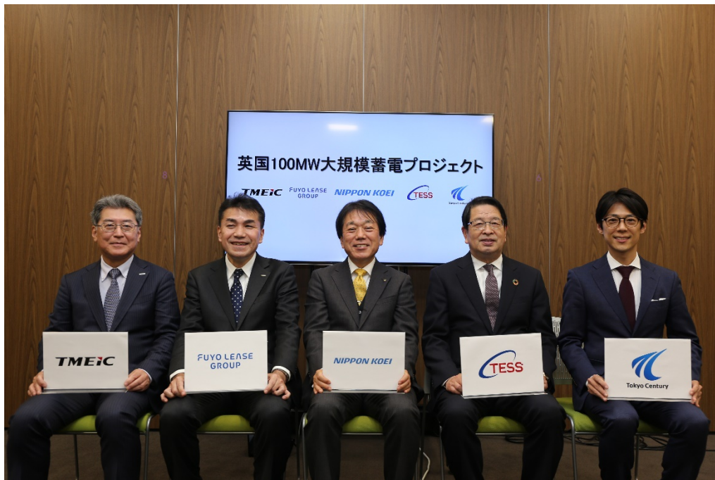
共同出資者 5 社による事業開始式にて

(左から、東芝三菱電機産業システム株式会社、芙蓉総合リース株式会社、日本工営株式会社、 テスホールディングス株式会社、東京センチュリー株式会社)