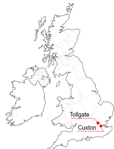
サイトロケーション

日本工営は欧州での両プロジェクトを通じ、再生可能エネルギー導入の先進地域で系統用蓄電池を用いたエネルギーマネジメントのノウハウを蓄積・向上させ、国内発電・送配電事業への展開を進めます。また、アンシラリーサービスを含む多様な蓄電池ソリューションの提案力を高め、国内外における再エネ導入拡大とエネルギー利用高度化・効率化を通じて気候変動問題へ積極的に取り組んでまいります。