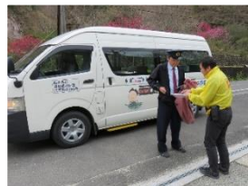
郵袋を村営バスに積載