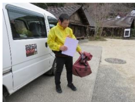
地区の郵便ポストから収集 した郵便物を郵袋に収納