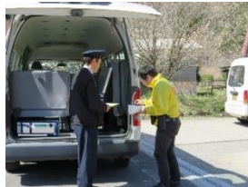
村の委託配達員が 荷物を受取り