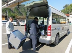
小川へ運ぶ荷物を積載