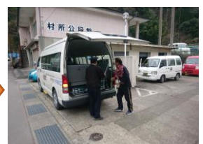
郵便局員が郵袋を受取り、 輸送完了