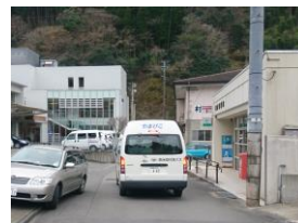
村営バスが郵便局前に 到着