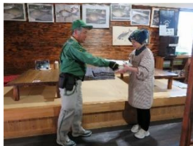
ヤマト運輸の荷物を 受取り、一時保管