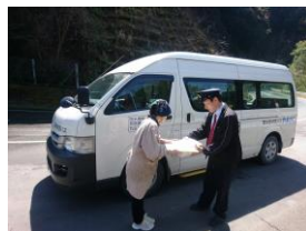
村営バスにヤマト運輸 の荷物を積載