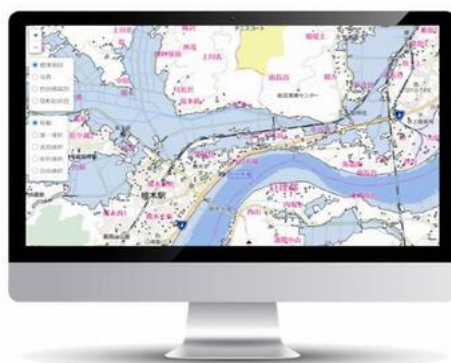
図3：衛星防災情報サービスの「システム画面イメージ」

*1 衛星防災情報サービス：3社は2021年4月より、『衛星防災情報サービス』としてLIANAに加え災害時に衛星データ(光学/SAR)とその解析によって、広域に浸水や土砂崩落といった災害状況を把握するためのサービスも構築中。