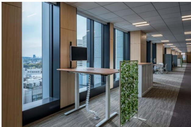
立ち会議テーブルスペース