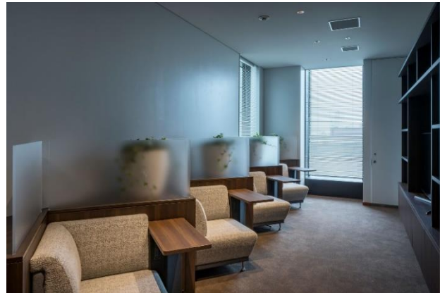
リフレッシュコーナー