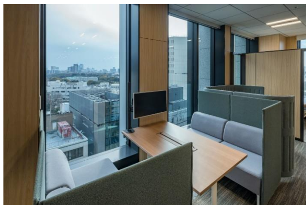
ボックス型ベンチシート