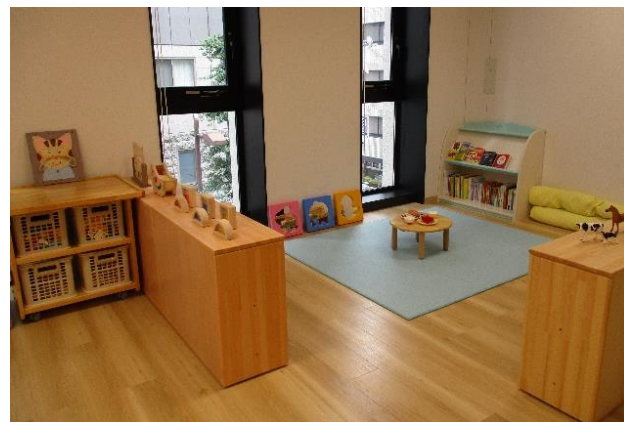
紀尾井町 PREX 内 日本工営託児所 (N-kids)