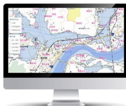
衛星防災情報サービスの「システム画面イメージ」