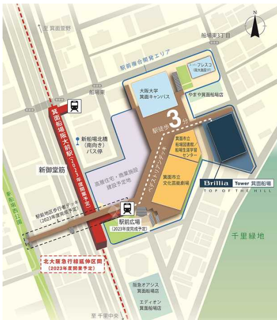
駅東側の複合開発エリア概念図