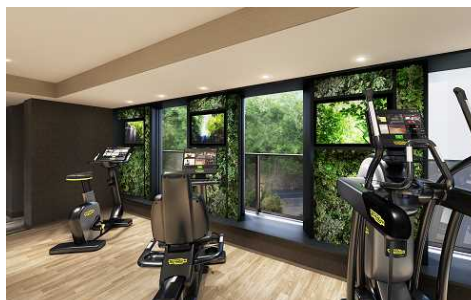
「ガーデンビュージム」イメージ