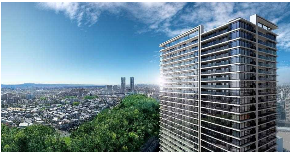
杜に囲まれた丘の上に立つ建物外観イメージ