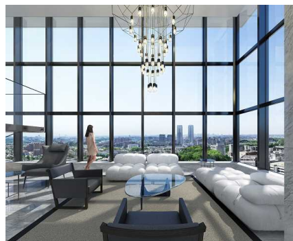
2層吹抜けのラウンジ及びゲストルーム 「ザ・スカイスイート」イメージ (橋本夕紀夫氏デザイン)