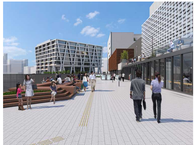
ペDESTリアンデッキで各施設をつなぐ複合開発エリアイメージ