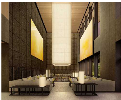
天井高11mの「アトリウムラウンジ」イメージ (グエナエル・ニコラ氏デザイン)