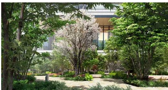
四季折々の花が咲き誇るガーデンイメージ