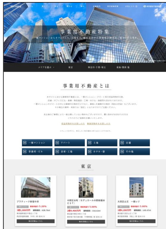
【事業用不動産特集】