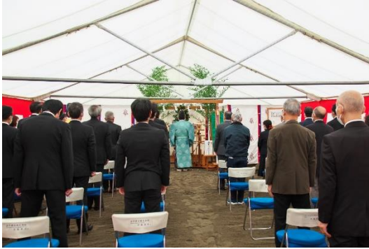
安全と繁栄を祈願する儀の様子

2022年10月13日(木)に開催されました起工式では、再開発組合理事や参加組合員である住友不動産(株)、東京建物(株)、大和ハウス工業(株)、一般財団法人首都圏不燃建築公社、設計・施工者である、五洋建設(株)、(株)大建設など、約30名が参列いたしました。地鎮の儀では、地元住吉神社宮司により、工事の無事や安全と、再開発による新築される施設や月島エリアの繁栄が祈願されました。