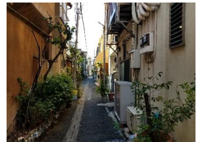
木造住宅密集地を解消し、防火機能の強化へ (2020年9月撮影)