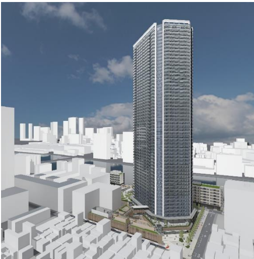
建物外観完成予想図

本事業は市街地再開発事業として着工しており、周囲の特性や環境等に配慮し、住宅・店舗・保育所・デイサービスが入る地上58階建てのタワーマンションを中核としたA街区、低中層建築物によるB-1街区(障がい者グループホーム等)・B-2街区(住宅他)の構成で建築を進めております。