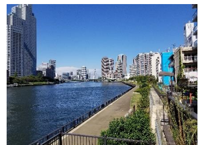
隅田川と商店街をつなぎ、 更なるエリアの賑わい創出へ(2020年9月撮影)