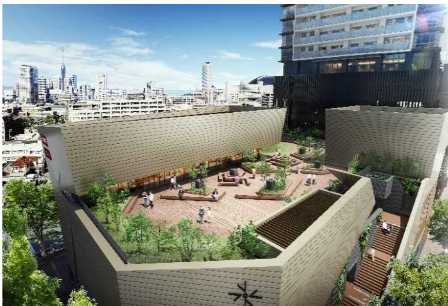
屋上庭園「ROOF GARDEN」イメージ

商業棟「PRALIVA」には、地域の方々にご利用いただける屋上庭園「ROOF GARDEN」を設置します。人々の交流を育み、訪れる人々に快適な空間を提供することで、地域の憩いの場として愛される場所となることを目指します。