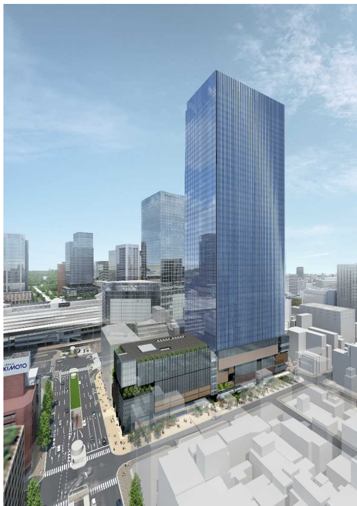
（外観イメージ※中央通り方面から望む）

また、当社は本事業を通じ、これからも組合の一員として権利者の皆様とともに、東京駅前にふさわしく、かつ、八重洲の歴史と伝統を未来に繋ぎ賑わいのある街づくりの実現に努めます。