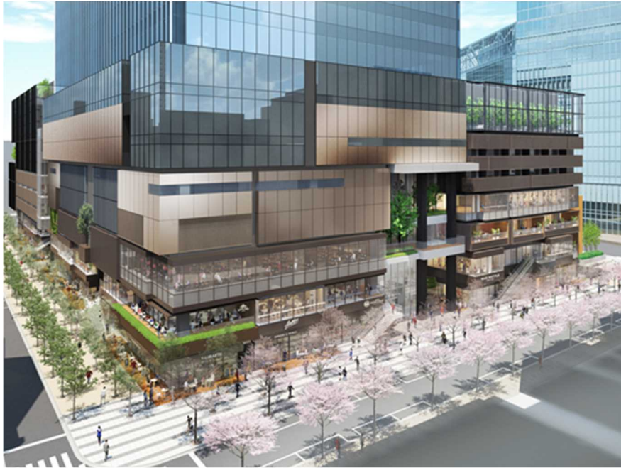
(さくら通り・八重洲仲通り沿いの低層部イメージ)