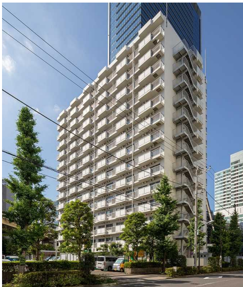
建替え前の本物件

このように、オフィスや商業施設等の開発が進む竹芝エリアにあって、本物件は職住近接の希少な「住」の場所として、studio（ワンルーム）タイプから3LDKまで、あらゆる世代の居住ニーズに対応した都心型住宅に建替えられ、更なる地域発展に貢献いたします。