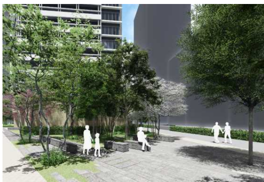
安らぎを感じる緑地空間

本事業は、総合設計制度を利用し、敷地内に緑豊かな公開空地を確保しているほか、屋上にはウォーターフロントの眺望を楽しめる約120㎡のテラスを計画しています。また、保育施設も導入予定です。