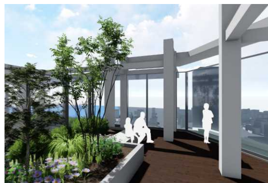
東京湾を一望する屋上テラス