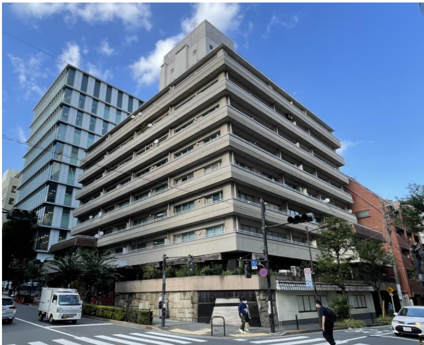
麹町山王マンション外観(2021年10月現在)

本建替え事業は総合設計制度を利用し、公開空地（約70㎡の広場状空地と幅約2m歩道状空地）を設けることで地域の安全性や快適性を高めるとともに街並みの整備にも寄与することから、容積率の緩和（約590%から約670%へ緩和）を受けています。