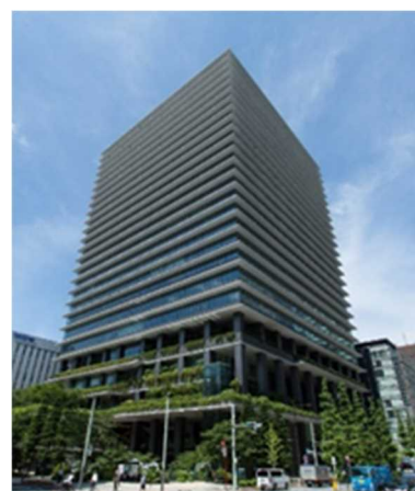
(東京スクエアガーデン外観)