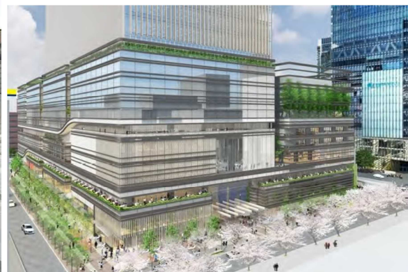
（さくら通り・八重洲仲通り沿いの低層部イメージ）