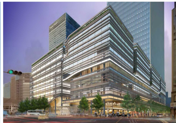
（八重洲通り・八重洲仲通り沿いの低層部イメージ）