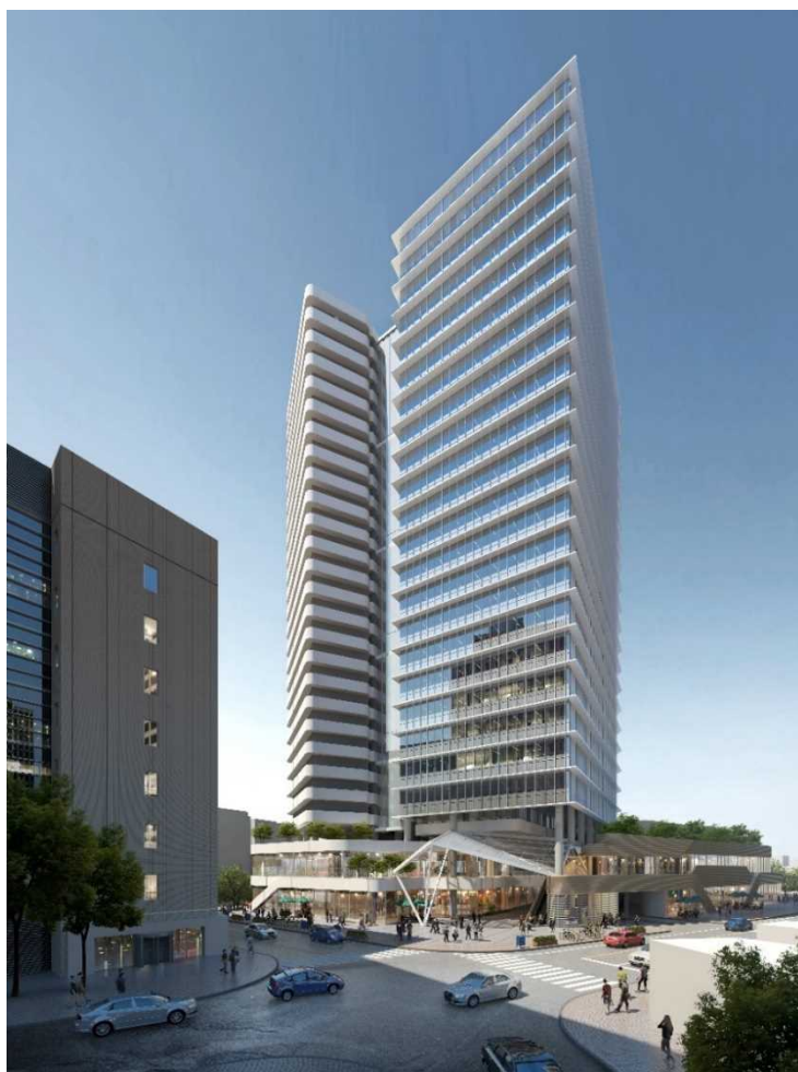
完成予想イメージ

本事業の計画地は、数多くの再開発が予定されている関東最大級のターミナル駅「大宮」駅西口より徒歩5分圏内に位置し、交通・生活利便性の高いエリアです。本事業では、大宮の新たな顔となる商業・オフィス・共同住宅の複合施設を整備し、地域の魅力向上に貢献してまいります。