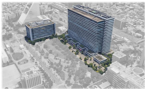
現在のイベント実施範囲

JR・東京メトロ「中野」駅周辺で複数の再開発計画が進行している中、中野駅近くに位置する本公園において積極的なイベント誘致等を行うことにより、再開発工事期間中のにぎわい維持や、再開発後も見据えたエリア全体の知名度および魅力度の向上、地域経済の活性化に取り組めます。また、本公園に隣接する東京建物保有のオフィスビル「中野セントラルパークサウス」を活用したより安全かつ一体的な管理体制を構築してまいります。