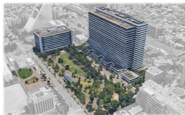
今後のイベント実施範囲