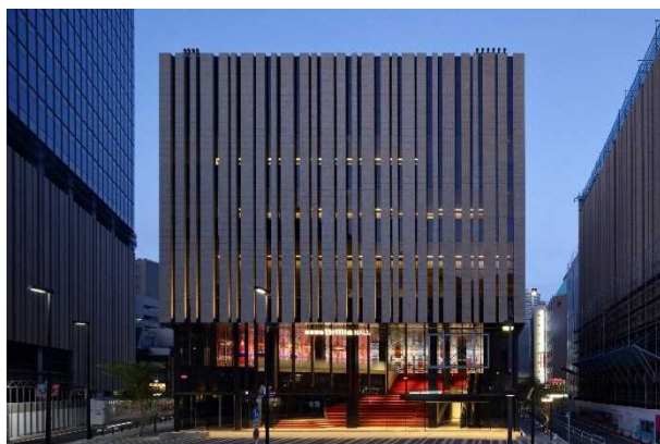
ホール棟（東京建物Brillia HALL／夜景）

本開業に合わせて、11月2日（土）、3日（日）の2日間にわたるHareza 池袋の関係各社と連携した開業イベント“池袋アニメタウンフェスティバル@Hareza”の開催を予定しているほか、豊島区が11月1日にHareza 池袋オープニングセレモニーを、11月2日に「東アジア文化都市2019 豊島 交流事業特別公演」を開催する予定です。