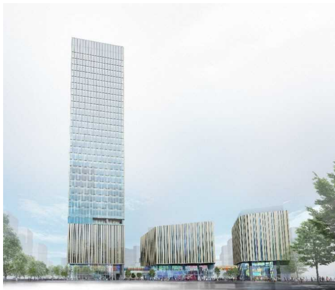
建物外観イメージ

(左: Hareza Tower、中央: 東京建物 Brillia HALL、右: としま区民センター)