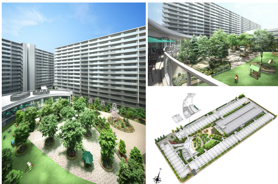
<左・右上：第Ⅰ・第Ⅱ街区建物外観完成予想図／右下：第Ⅰ・第Ⅱ街区敷地配置完成予想図>

「Be Happy. 新都心から、日本の幸せを変えよう。」をテーマとして、“住む人一人ひとりがより多くの幸福を感じられる街づくりを”をメインコンセプトに、豊かな住環境づくりを目指した《SHINTO CITY》。東京都心へのアクセスも良好なJR「さいたま新都心」駅から徒歩5分という交通利便性と、大型複合商業エリア「コクーンシティ」や赤十字病院、さいたまスーパーアリーナなどに近接する生活利便性を併せ持つ、埼玉県最大級の計画戸数を誇る一大プロジェクトです。土地区画整理により新しく整備されたエリアに新しいランドマークとして誕生します。