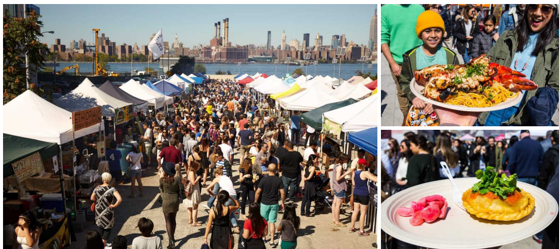
昨年、ブルックリンで行われたスモーガスバーグの様子

「スモーガスバーグ」とは、ニューヨーク州ブルックリンで毎週末開催されている移動型野外フードマーケットで、Brooklyn Flea 社による厳しい審査に合格した店舗だけが出店できるものです。ラクレットサンドウィッチやジューシーなチーズバーガー、日本では決して食べられないユーモア溢れるアイスクリームなどを扱う店舗が軒を連ね、2011年の初開催以降、ニューヨークでは定番の人気スポットになっています。今回、関東“初”となる、さいたま新都心での開催が決定しました。本場 NY ブルックリンから人気店舗 5 店舗を招致するほか、大阪飯・名古屋飯からスペイン料理・イタリア料理までさまざまな料理も味わえ、本場ブルックリンの雰囲気を楽しめる今秋注目のおでかけスポットとなります。