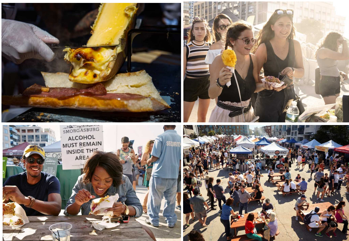
スモーガスバーグの風景

「スモーガスバーグ」は Brooklyn Flea 社の厳しい審査に通った店舗だけを招致し、提供される料理はどれもクオリティが高く、個性と目新しさに溢れています。また、このフードマーケットがインキュベーション（新規事業を支援すること）の役割を担い、出店を契機に話題となり、常設店を構えるまでに成長するケースも多く見られます。