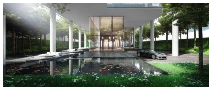
完成予想CG (エントランス)