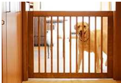
飛出し防止ゲート