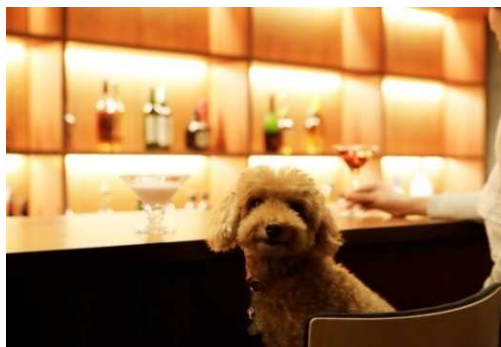
愛犬用カクテル(旧軽井沢、軽井沢御影用水、富士にて提供)

当リゾートは、愛犬と一緒に安全快適に、楽しくお過ごしいただける工夫を随所に施しております。