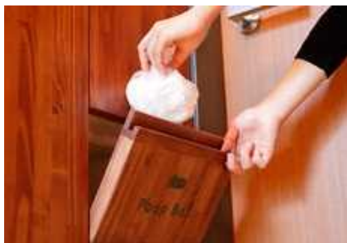
壁面収納型汚物専用ダクト(旧軽井沢にて設置)