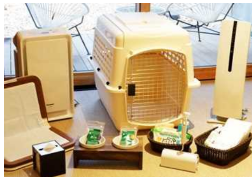
豊富な愛犬用備品