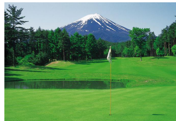
▲ 河口湖カントリークラブ