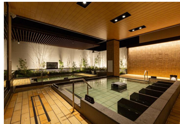
▲ おふろの王様 和光店