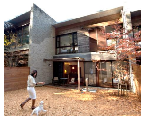
▲ レジャーリゾート富士