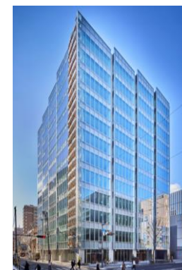
▲ T-PLUS 仙台