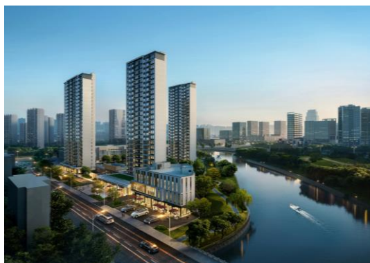
▲ 温州甌海プロジェクト