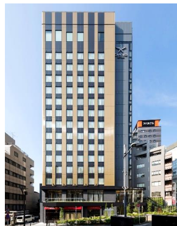
▲ カンデオホテルズ東京六本木