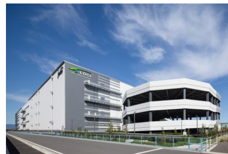
▲ T-LOGI 一宮