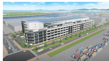
▲ (仮称) T-LOGI 福岡アイランドシティ