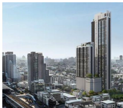
▲ リファレンスプロジェクト