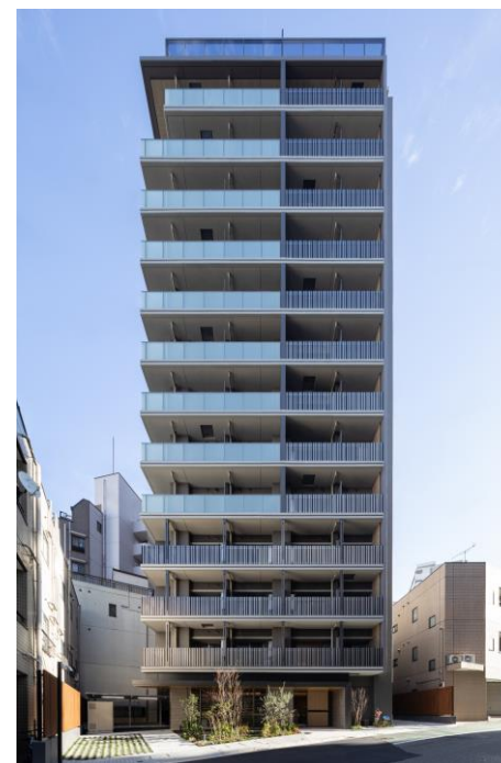
▲ Brillia ist 大井町