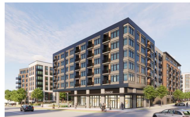
▲ ハーンドンプロジェクト