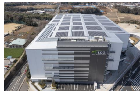
▲ T-LOGI 千葉北