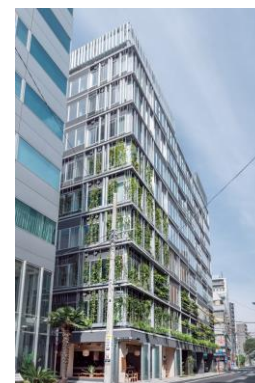
▲ T-PLUS 日本橋小伝馬町