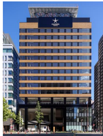
▲ カンデオホテルズ大阪心斎橋