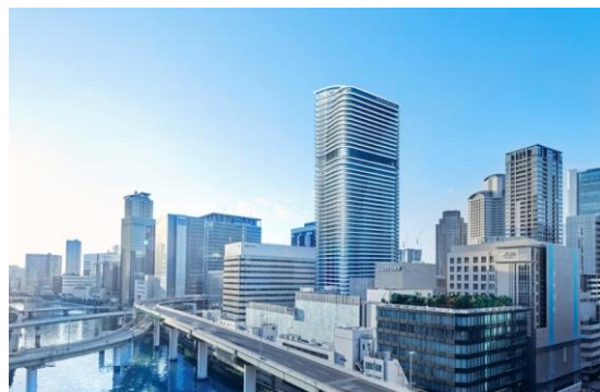
▲ Brillia Tower 堂島