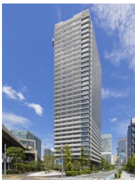
▲ Brillia Tower 浜離宮