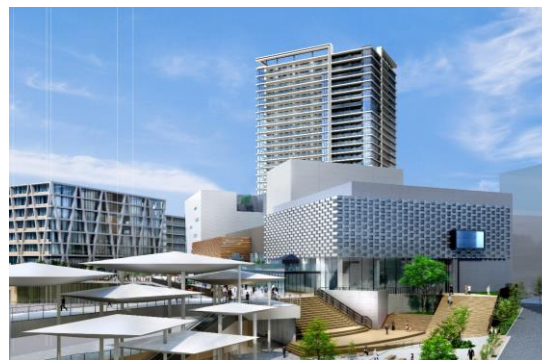
▲ Brillia Tower 箕面船場 TOP OF THE HILL