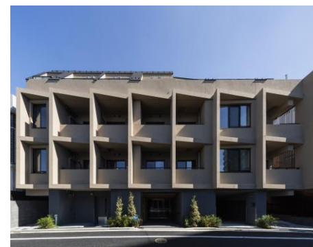
▲ Brillia ist 文京六義園