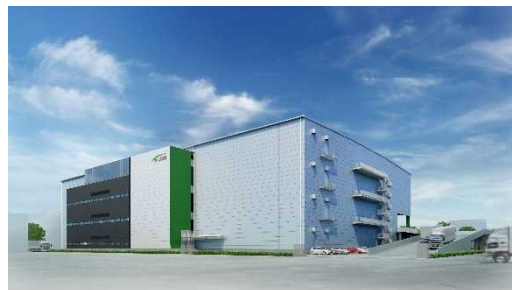
<(仮称)T-LOGI習志野 イメージパース>