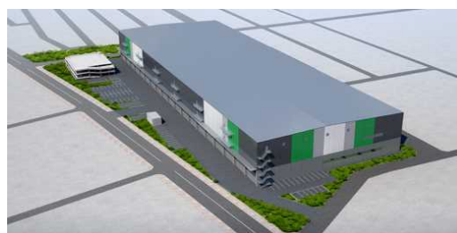
<(仮称)T-LOGI武蔵引田 イメージパース>