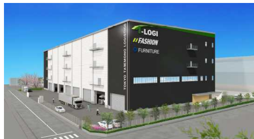
<(仮称)T-LOGI横浜青葉 イメージパース>