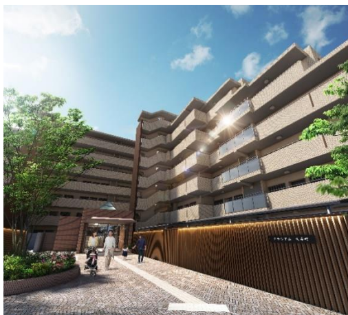
建物外観イメージ

エントランスは、オートロック化・高画質防犯カメラ設置によるセキュリティ向上、デザイン性の高いルーバー設置や外構部植栽リノベーションによる美観向上など、全面改修を実施します。室内については、キッチン・トイレの更新や暖房換気乾燥機付浴室へのアップグレード、和室の洋室化(一部)等により居心地の良さを高めます。そのほか、機械式駐車場修繕工事など先を見据えた各種修繕工事を実施します。