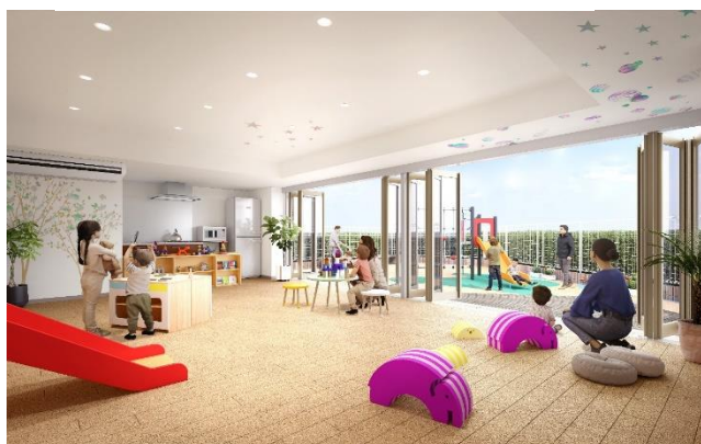
キッズスペースイメージ