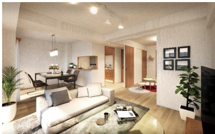
リビングイメージ