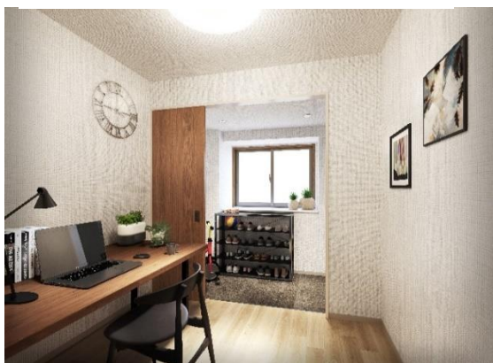
リモートスペースイメージ