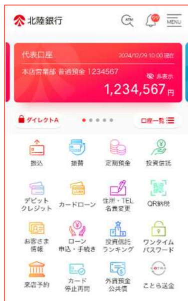
▲「北陸銀行ポータルアプリ」イメージ

本アプリは幅広い世代のお客さまにご利用いただいておりますが、特に若年層やビジネスパーソンを中心に大好評をいただいております。また、日常の銀行取引をよりスムーズかつ安心して行えるサービスとしてアプリ頒布サイトでは「星4.3以上」の高い評価をいただいております。