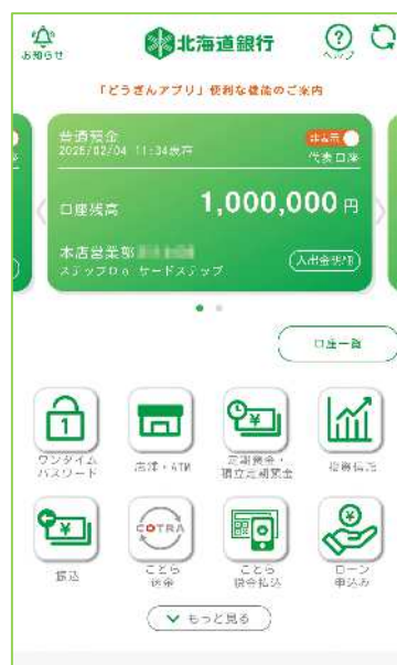
▲「どうぎんアプリ」イメージ