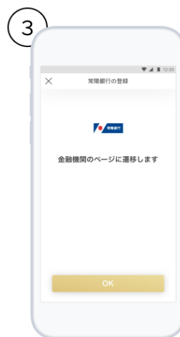
③ 画面に沿って会員・口座情報を入力