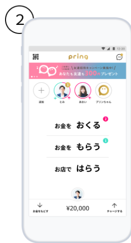
② 「チャージする」をタップ