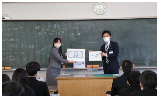
高校生向け出前授業

また、政府の掲げる「資産所得倍増プラン」の実現に向け、個人のお客さまに対して、NISA口座の利用を積極的に推進しており、常陽銀行、足利銀行においてNISA口座を開設いただいているお客さまは、合計で20万人を突破しております。