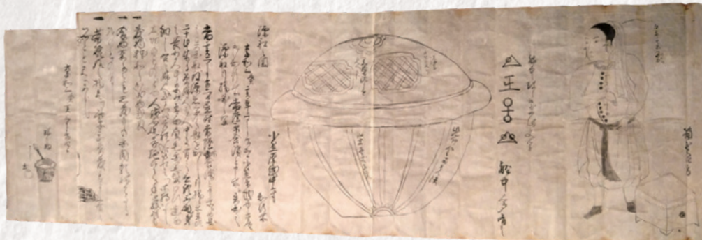
「日立文書」(個人蔵) ※2/19(日)までの展示となります。