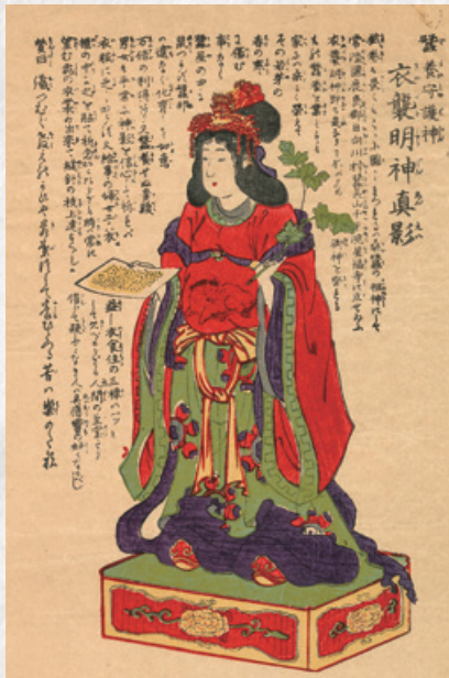
錦絵「養蚕守護神衣裝明神真影」