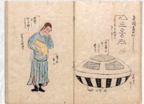
『弘賢随筆』(国立公文書館蔵) — パネル展示 —