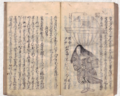
『篤宿雑記』(国立国会図書館蔵) — パネル展示 —