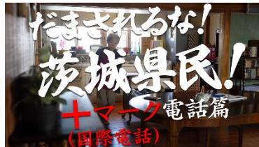
【動画その2イメージ】