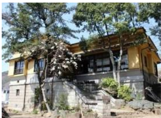
敷地内の旧矢中家住宅 (HP より)

※矢中の杜…建材研究家・実業家の矢中龍次郎氏によって、つくば市北条地区に建てられた昭和初期の近代和風住宅です。2011 年に国登録有形文化財に登録されました。