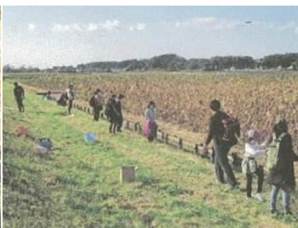
霞ヶ浦流域環境学習ツアー（霞ヶ浦の源流の一つである雪入川を探索）