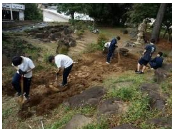
筑波高校の授業「つくばね学」にて 庭園の石畳の復旧