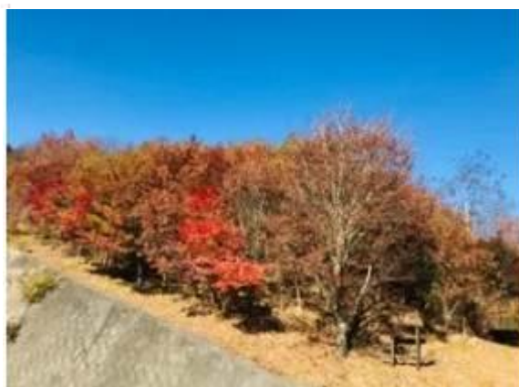
2011年に植樹したブナ群生