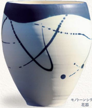
モノトーンシリーズ 花器