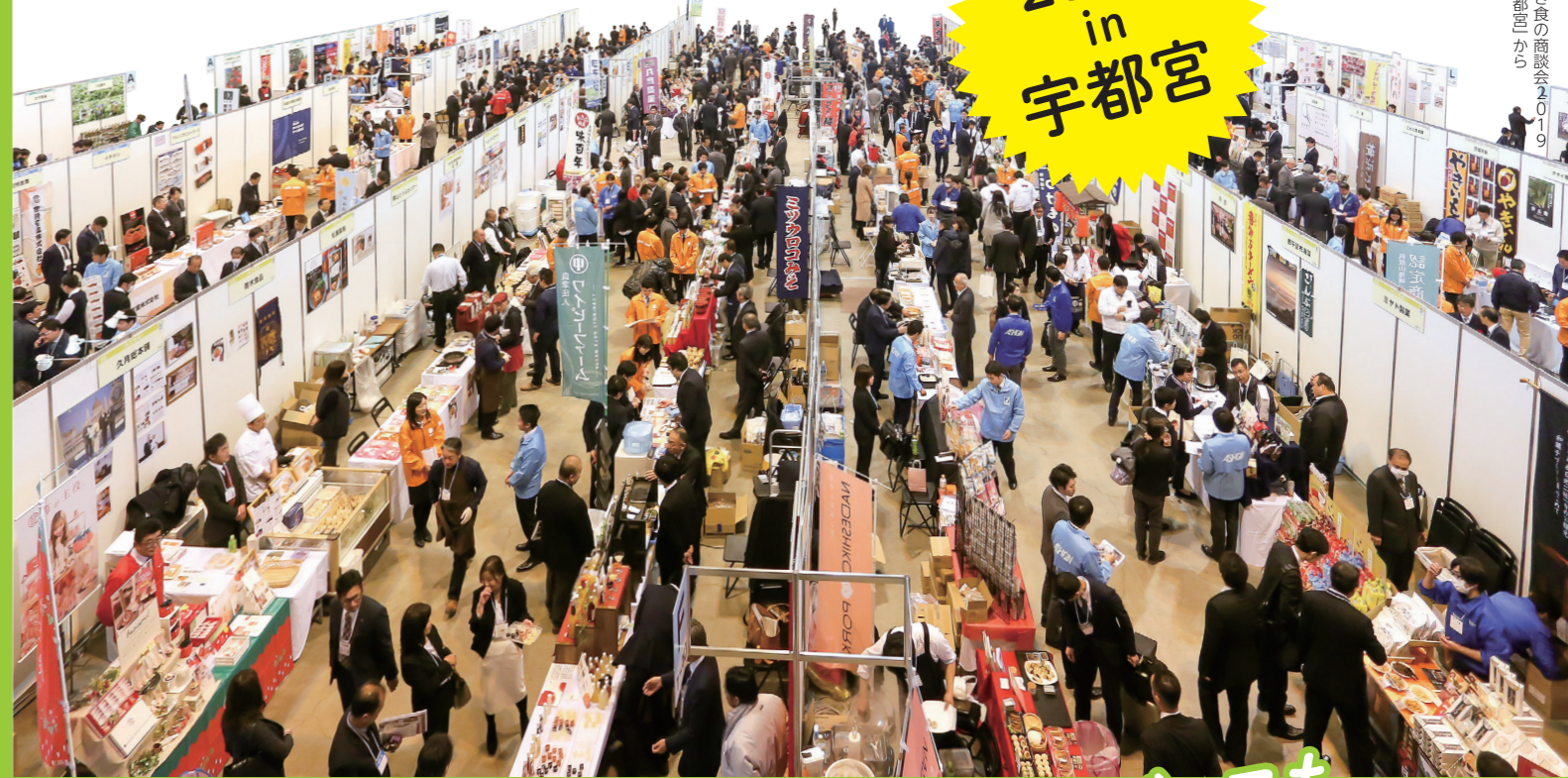
写真：めぶき食の商談会2019 in 宇都宮から