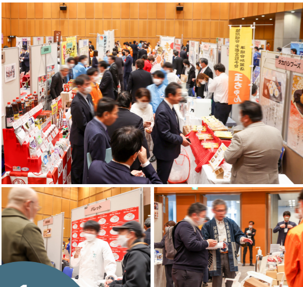
写真：展示商談会の様子（「めぶき食の商談会2024 in つくば」から）