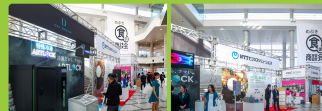
写真：「めぶき食の商談会2024 in つくば」から特設展示ブースの様子