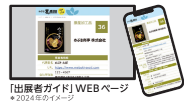
「出展者ガイド」WEBページ *2024年のイメージ