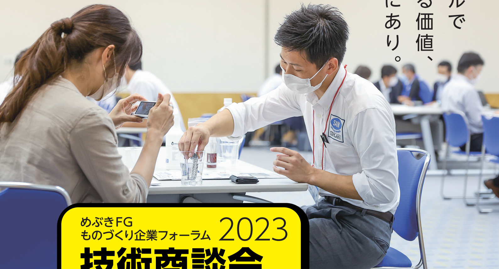
*2022年開催の様子です。