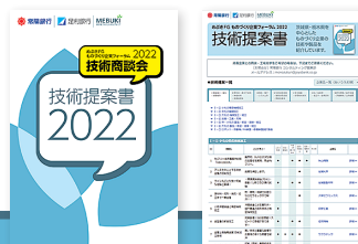
前々回の技術提案書とWEBページのイメージ

2023年8月30日(水) 10:00～17:00 (オープニングセレモニー 9:45) つくば国際会議場