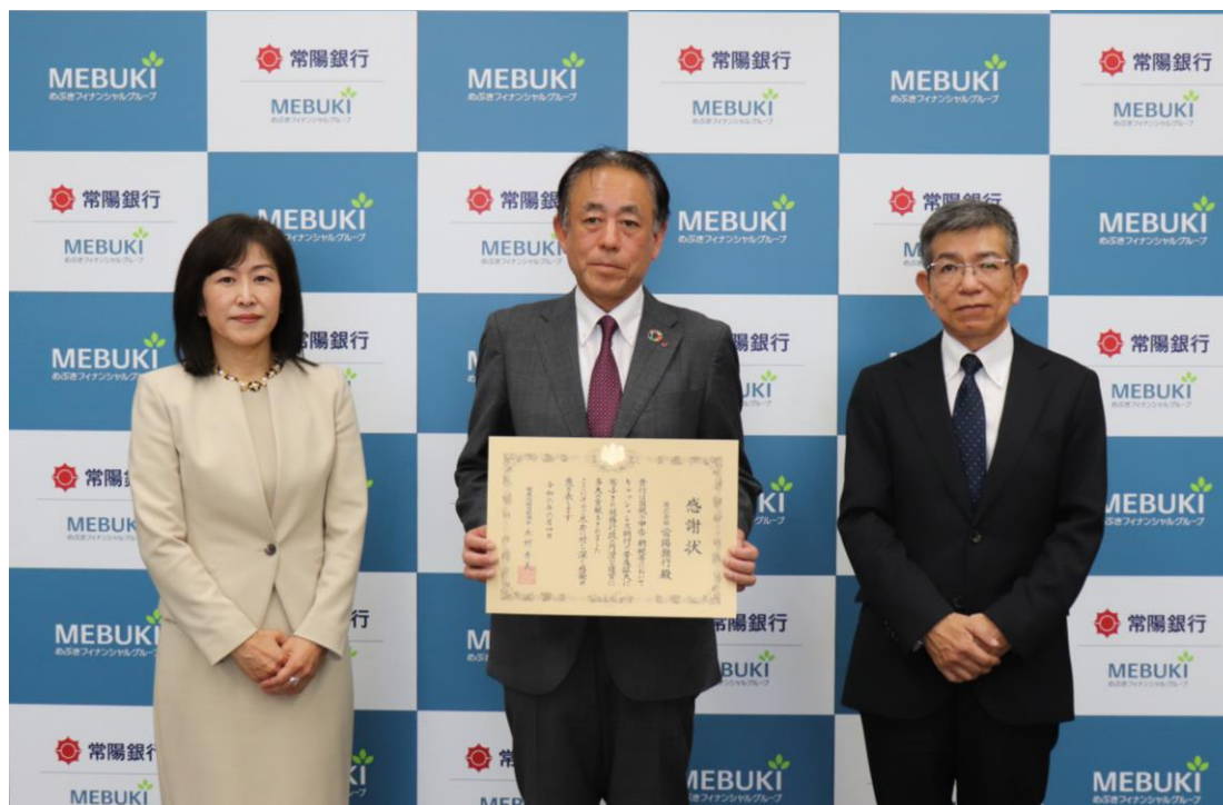
(左から 木村関東信越国税局長、秋野頭取、松壘水戸税務署長)