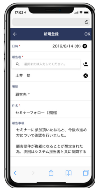
営業日報の登録画面イメージ