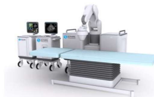
次世代型超音波ガイド下 HIFU 治療装置 (イメージ図)

※HIFUの多点照射により発生させた気泡を活用して患部を加熱し、がん細胞を壊死させる治療。