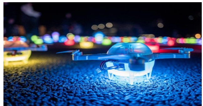
ドローンショー・ジャパンが開発する、ドローンショー専用機体「unika（ユニカ）」