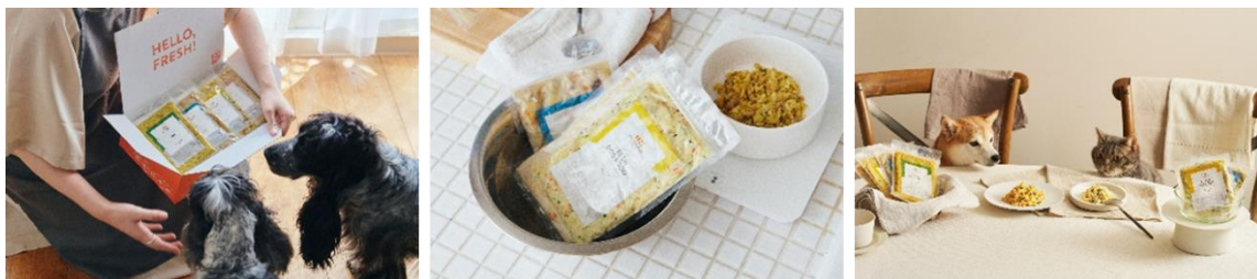
「エサ」を「ゴハン」と呼ぶ世界を目指した、人間でも食べられるクオリティの『ペトコトフーズ』

フレッシュフード「ペトコトフーズ」はサービス開始から3年で売上12倍超と急成長を続け、定期購入継続率は94%に上ります。「OMUSUBI」および「ペトコトメディア」の月間PV数（ページ表示回数）は計400万、すべての顧客データを一元管理する「PETOKOTO ID」の数は10万超、関連SNSのフォロワー数は計30万など、日本最大級のペットコミュニティを有しています。