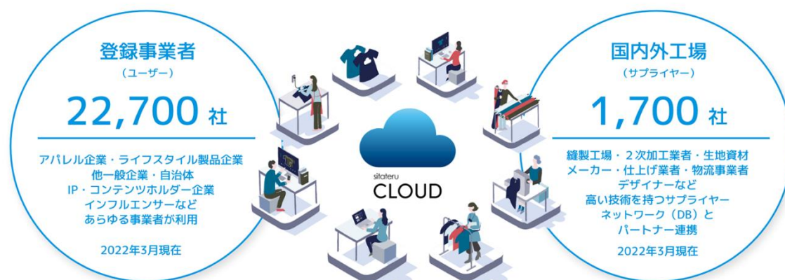
sitateru CLOUD のイメージ

「クラウドサービス」である衣服生産プラットフォーム『sitateru CLOUD』は、ものづくりの効率化・DX を推進する「生産支援機能」と、あらゆる事業者のアイテム販売・DtoC(ダイレクト・トゥー・コンシューマー)事業をサポートする「販売支援機能」を兼ね揃えた、クラウドサービスです。