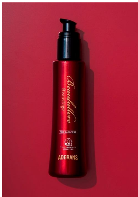
「ビューステージ ビューフラーレ」

※ 4 香料、着色料、パラベン、鉱物油、アルコール、石油系界面活性剤、合成酸化防止剤、紫外線吸収剤不使用