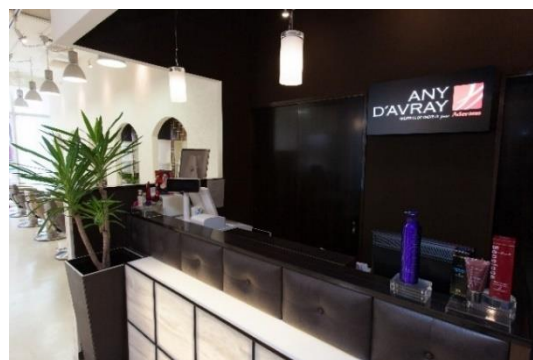
『アニーダブレイ福岡けやき通り』