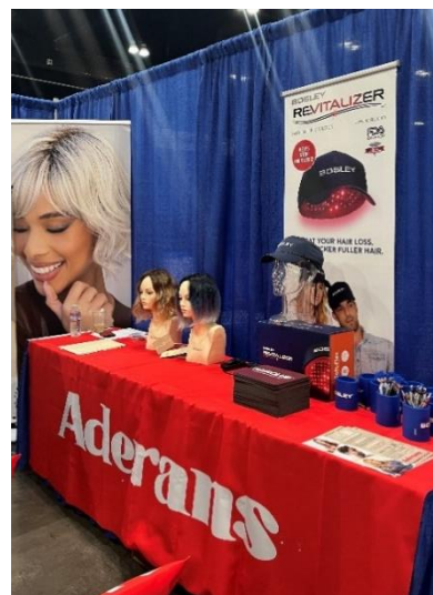
昨年の会社説明会の様子