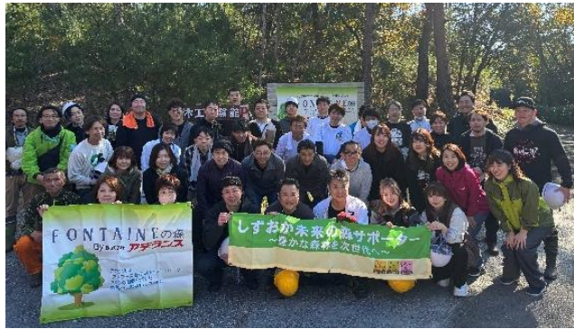
参加メンバーの集合写真（12月）

1月の苗作りには昨年続き、地元の百貨店である遠鉄百貨店様が取締役の方を含めた3名にもご参加いただきました。2回の作業でのべ74名が参加し、活動の輪が広がっています。アデランスでは、当活動を通じて自然景観が豊かなアカマツ林の再生を支援してまいります。