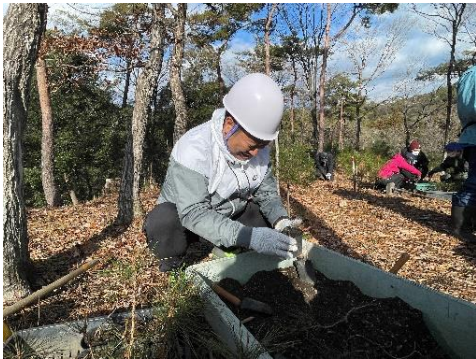
ポット苗作りの様子（1月実施）

当社では、使われなくなったウィッグの回収と環境保全をつなげる「フォンテーヌ緑の森キャンペーン」を、2009年から16年継続しており、2019年12月からは、静岡県立森林公園のアカマツ林の再生活動をサポートしています。アカマツ林の再生には数十年ほどかかり、作業工程として苗木の植栽のほか、苗木の成長を妨げる枯葉や倒木を取り除く作業（除伐）や日光が当たるよう、雑草木等を刈り払う（下刈り）など様々あります。今回当社は12月に下刈り、1月に来年植栽するアカマツの苗作り（244個）を行いました。