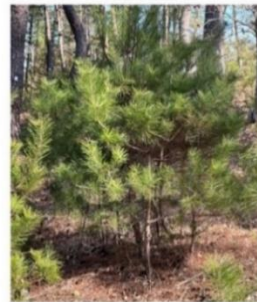
アカマツの木 ～成長の記録～