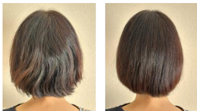
髪の内部が空洞化することによるうねりが軽減し、 パサつき・まとまり・ツヤ感が向上