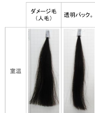
パサつき、ダメージ毛のうねりが軽減し、まとまり向上