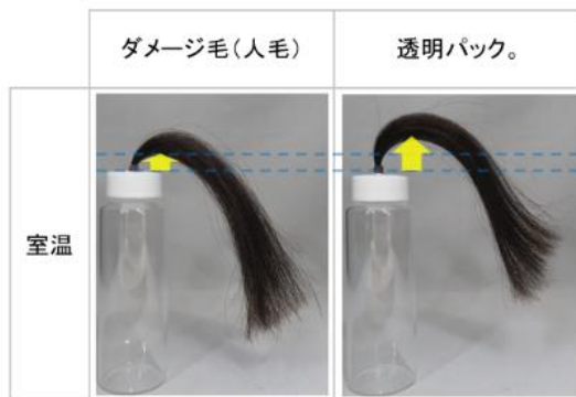
ハリ・コシが向上