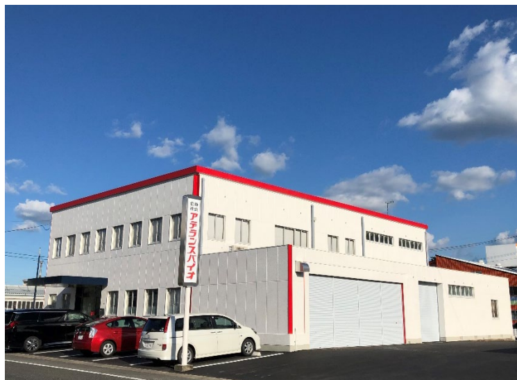
アデランスバイオ 本社兼工場外観