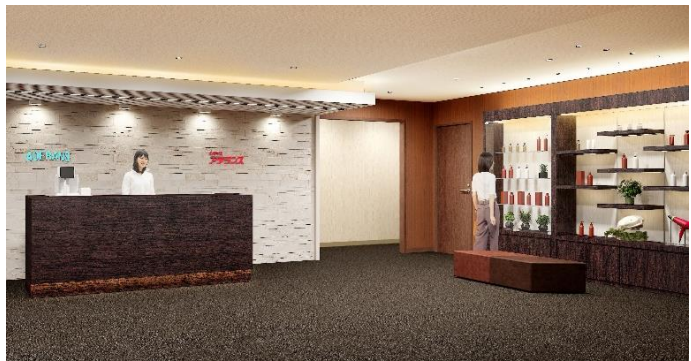
ディスプレイスペースが隣接するエントランス（イメージ図）

カウンセリングルームには、頭皮の状態をチェックし、お客様にご覧いただきやすいよう大型モニターを設置しました。専門のヘアスタイリストがお客様の魅力を最大限に引き出すオーダーメイド・ウィッグや増毛、育毛などトータルケアをお手伝いします。また、大学やパートナー企業との共同研究など、毛髪研究から生まれた、機能的なヘア&スカルプケア商品も豊富にラインナップしております。さらに、他社でウィッグを購入したが、スタイルが合わない、カラーが合わない、メンテナンスができないなど、お悩みの方にもアフターメンテナンスを実施しておりますので、お気軽にご相談いただけます。