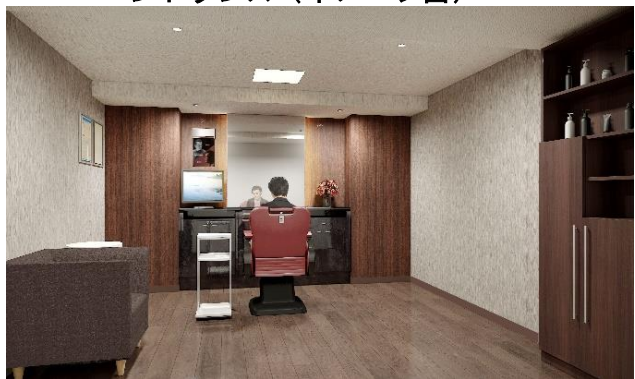
男性用納品ブース（イメージ図）