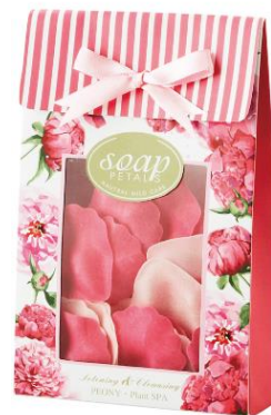
フラワーペタルソープ（女性向け）