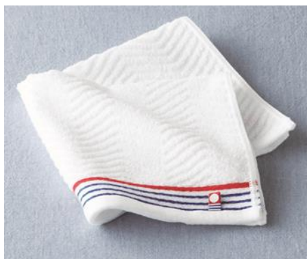
今治あやなみハンドタオル （男性向け）