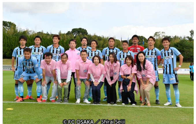
選手を交えた集合写真