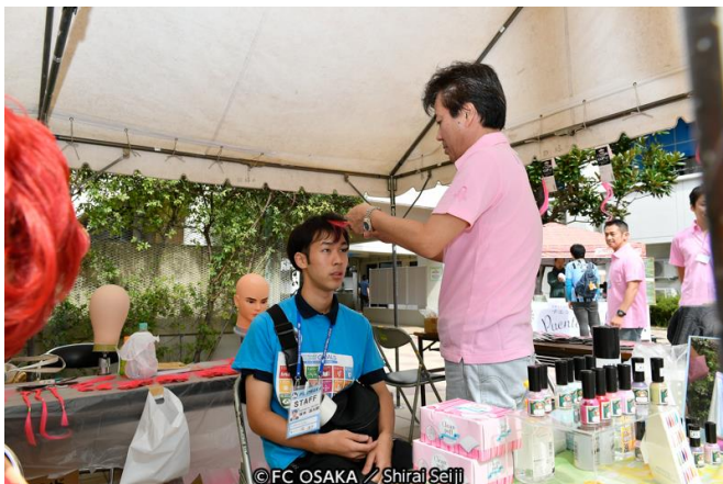
ヘアエクステンションを施す様子

当社のブースでは、ご来場のサポーターの皆さんに当社の医療事業に関する活動をまとめた冊子、コンパクトミラー、爪やすりを進呈すると共に、希望者にはピンク色のヘアエクステンション（付け毛）を当社の技術者がお一人おひとりにお着けしました。更に、募金を行っていただいた方へ、当社オリジナルのピンクリボンバッチを進呈しました。募金活動で集まったお金は、特定非営利活動法人ピンクリボン大阪へ寄付しました。