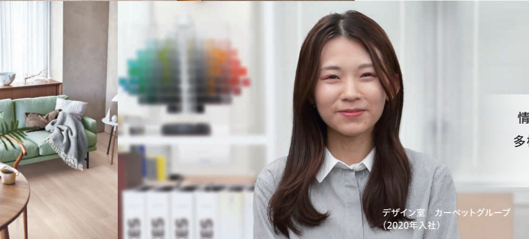
デザイン室 カーペットグループ (2020年入社)