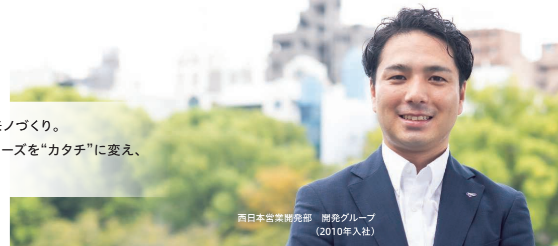
西日本営業開発部 開発グループ (2010年入社)

顧客との対話から生まれるモノづくり。 メーカーの強みを活かしてニーズを“カタチ”に変え、 そして信頼へと繋げていく。