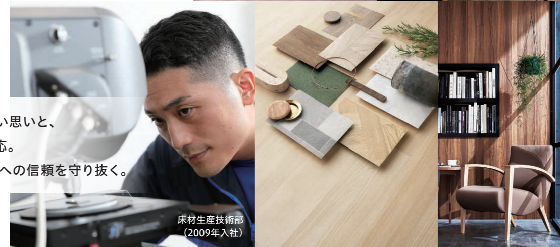
床材生産技術部 (2009年入社)

モノづくり・品質向上への熱い思いと、 迅速かつ丁寧な顧客への対応。 私たちが、確かな品質と技術への信頼を守り抜く。